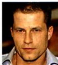
Til Schweiger Schauspieler, ebenfalls Feuertyp (19. 12. 1963), bräuchte ein Bad mit hohen Fenstern und einer Wanne im Zentrum